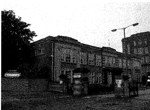
ヨークのクラフト (テリーズ) の工場跡 (2006.9) 現在GHT Developments LLPの所有となっている