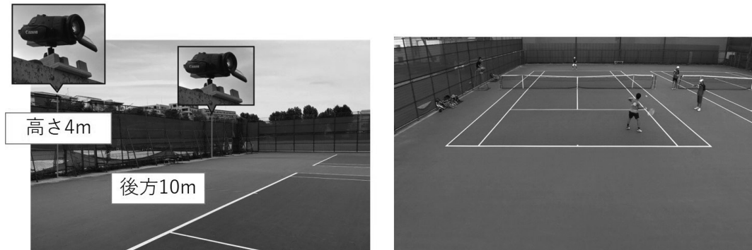
図1 ビデオカメラの設置位置（左）と試合映像のスクリーンショット（右）